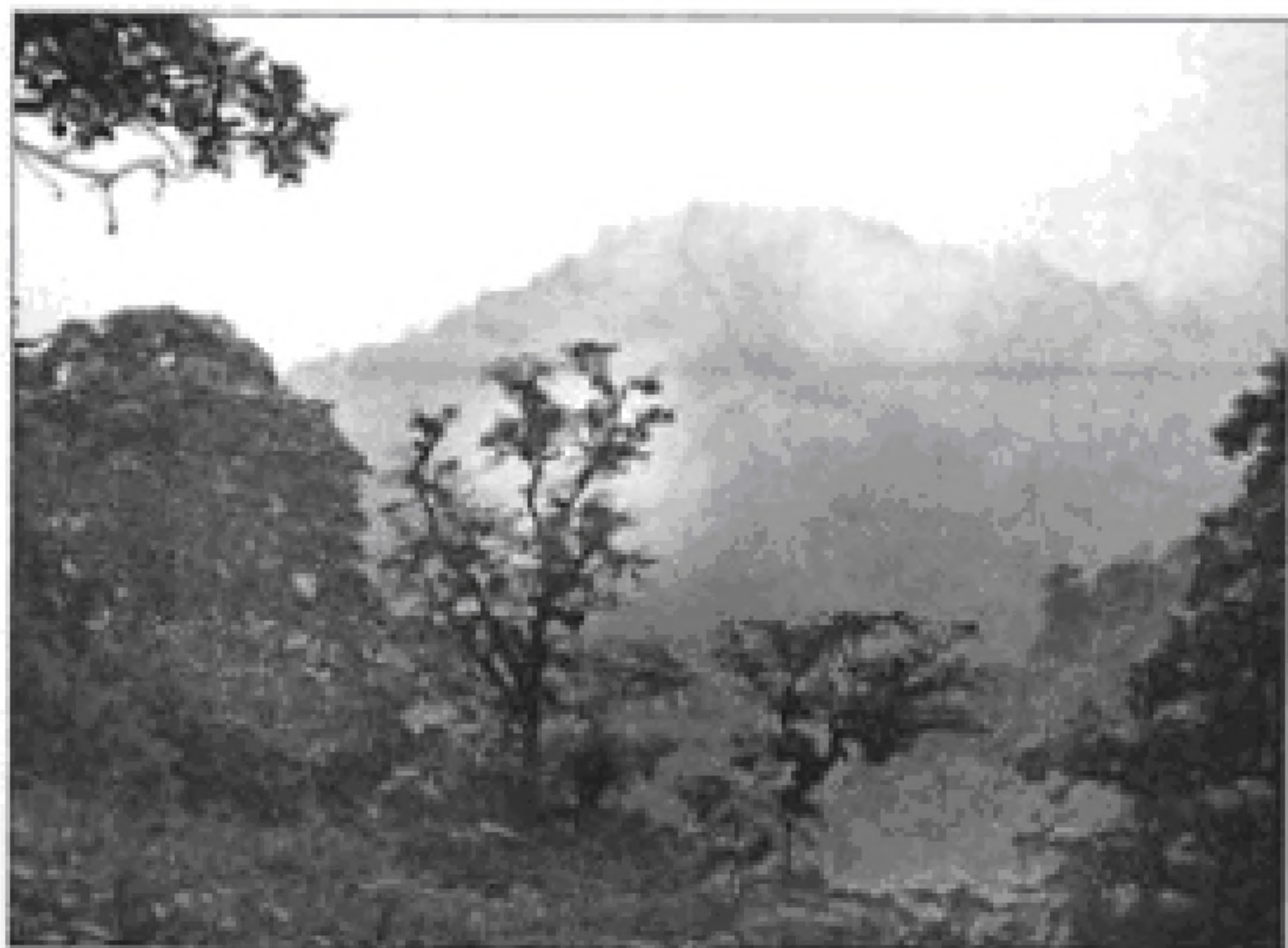
ناحیه مرطوب خزری

۳۴- کدام گزینه با تصویر روبه‌رو ارتباط دارد؟